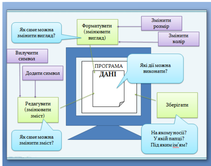
Рис.3. Орієнтовний вигляд частини результатів діяльності

Поданий приклад демонструє застосування одного з можливих методів навчання, у яких учитель виступає не носієм знань, а тільки організовує процес їх самостійного здобуття, спрямовує й координує навчально-пізнавальну діяльність, знаходячись у постійному діалозі з учнями.