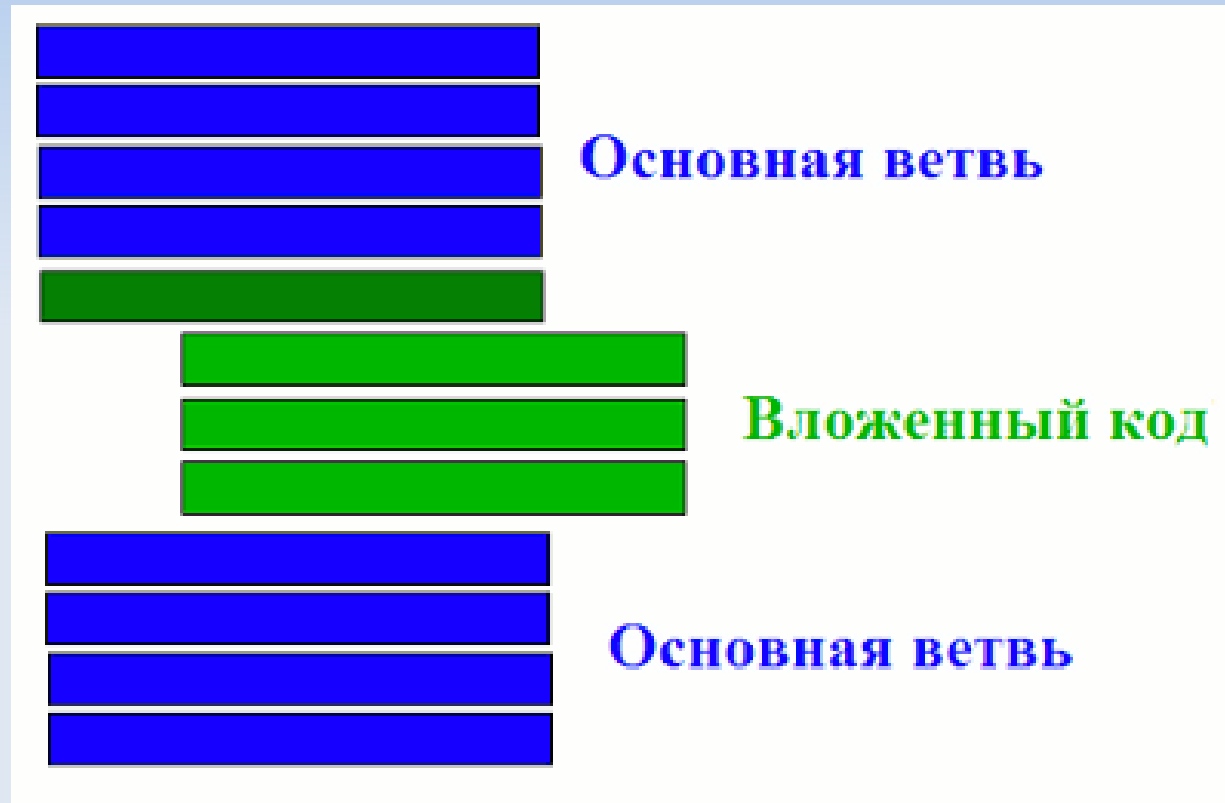
Схема программы с инструкцией if